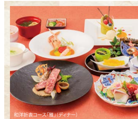
和洋折衷コース「雅」(ディナー)