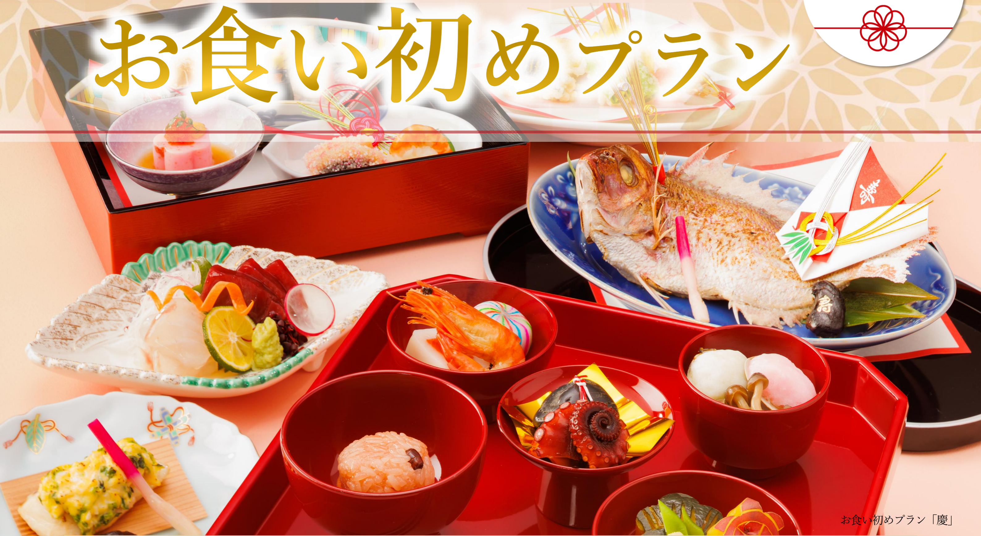
お食い初めプラン「慶」